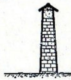
Pas de châssis libre